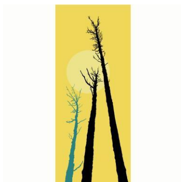
Noe du lurer på – etterpå – 916 55 156